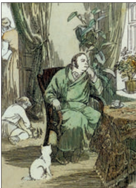
Иллюстрация к роману И.Гончарова «Обломов». Акварель, тушь, перо. 2010.

ровать учебные задачи, меняя их от задания к заданию.