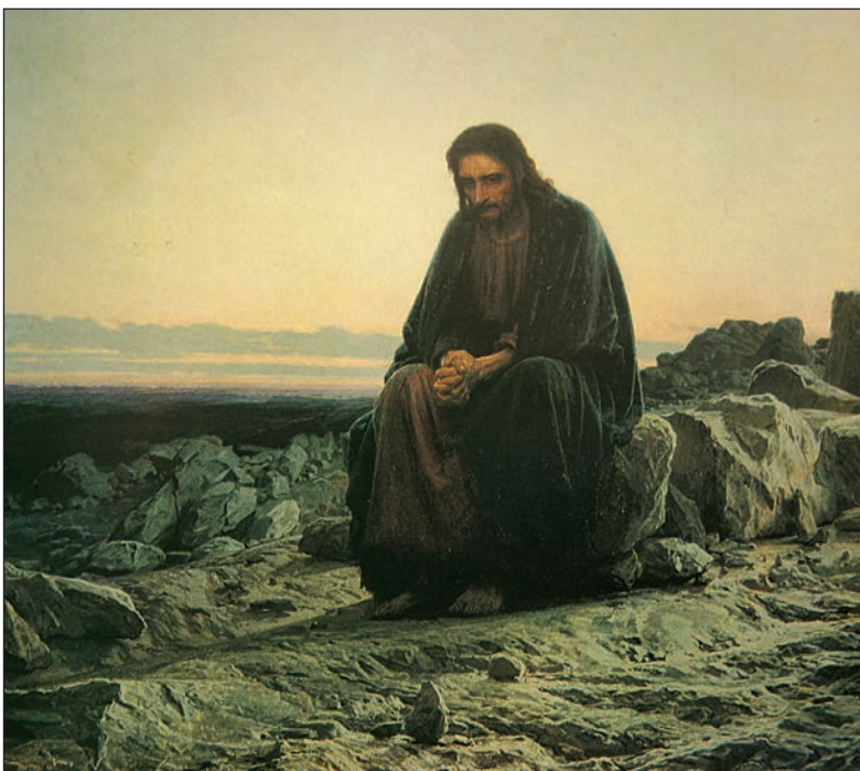
И. Крамской. Христос в пустыне. Холст, масло. 1872.

Безусловно и безоговорочно все у Третьяковых полюбили Васнецова. Первое появление Виктора Михайловича у нас я ясно помню. В 1878 году, когда Передвижная выставка была в Москве, несколько художников приехали к нам на дачу в Кунцево, среди них был и Васнецов. Когда он написал свои сказочно-былинные вещи «Витязь на распутье», «Ковер-самолет» и «Скифы», сделанные для Мамонтова, они были так новы, так увлекательны, так поэтичны, что навсегда привлекли наши симпатии к художнику. Между 1880 и 1885 годами появлялись новые произведения. Когда мы приходили к Васнецовым, нам показывали «Аленушку», эскизы панно «Каменного века» для Исторического музея, «Три царевны», потом начатого «Серого волка», «Богатырей». Последние две неоконченные картины он увез в Киев, где работал над украшением Владимирского собора.