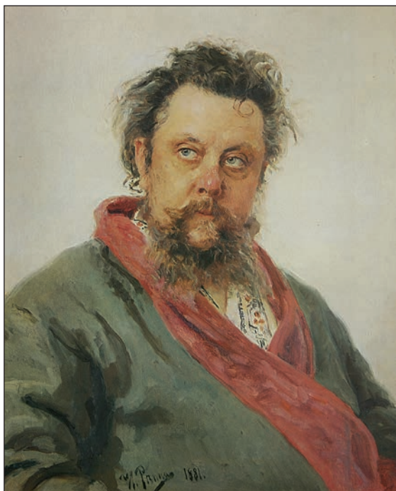
И. Репин. Портрет композитора М.П.Мусоргского. Холст, масло. 1881.